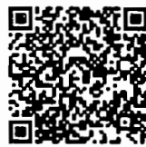
บันทึกการประชุมสภา สำนักrayงาน การประชุมและตัวเลข