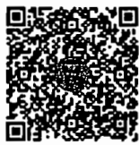
หนังสือนัดประชุม และระเบียบวาระการประชุม ประชุมร่วมกันของรัฐสภา

เอกสารประกอบการประชุมร่วมกันของรัฐสภา ได้เผยแพร่ทางสื่ออิเล็กทรอนิกส์ ตามข้อบังคับการประชุมรัฐสภา พ.ศ. ๒๕๖๓ ข้อ ๑๓ โดยท่านสมาชิกฯ สามารถอ่านเอกสารประกอบการประชุมได้ โดยการสแกน QR code หรือทาง www.parliament.go.th